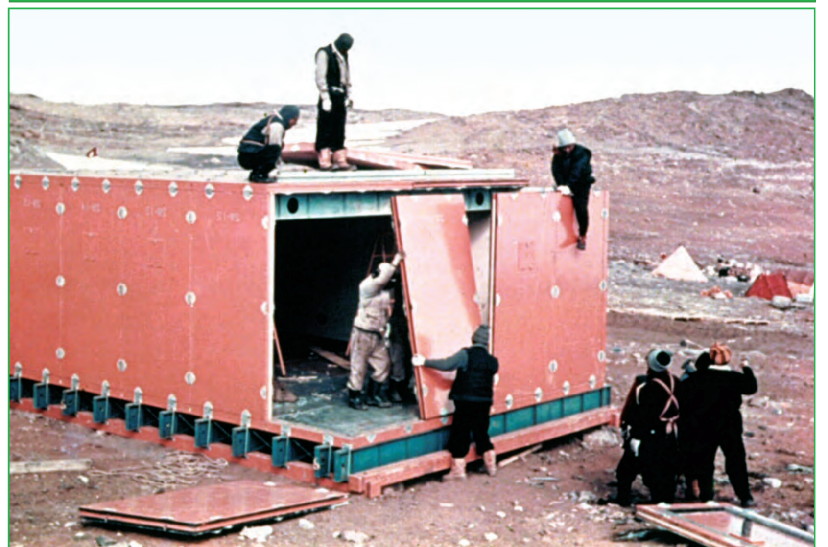
第一次隊建設風景